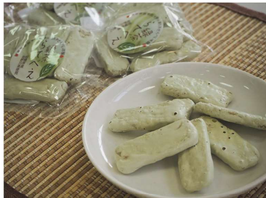
完成した緑茶ラテ味のせんべい「らてべえ」