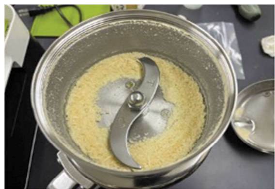
さつまいもバターの粉末