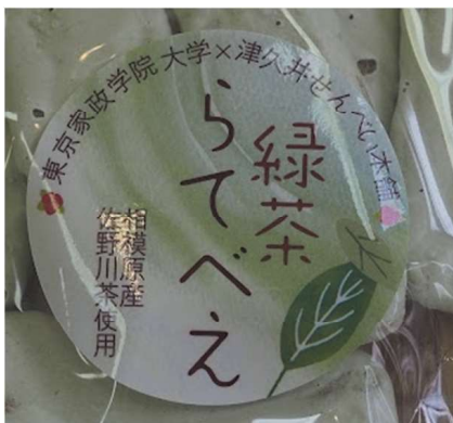
パッケージデザイン

(有)津久井せんべい本舗の工場での試作を重ねた結果、「緑茶ラテ」のせんべいが完成しました。そして、その商品のパッケージデザインの作成もさせていただきました。背景には、緑茶とラテのミルク感をイメージさせる、緑と白を使用し、混ぜている様子を表現することで、緑茶ラテを連想させるデザインとしました。また、商品名は「らてべえ」としました。緑茶ラテせんべいに可愛らしさと親しみを持ちやすいように、ラテは平仮名にし、せんべいのべいの言い方を崩してべえとしました。