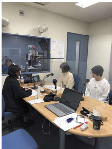
出演中のひとコマ