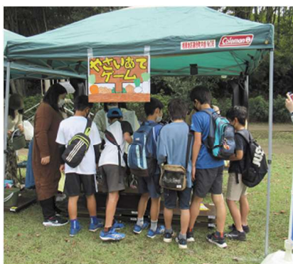
「魚釣りゲーム」の参加者