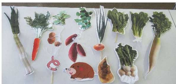
「野菜当てゲーム」の野菜