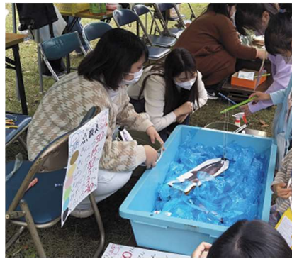
「魚釣りゲーム」の参加者と参加者に対応する学生の様子