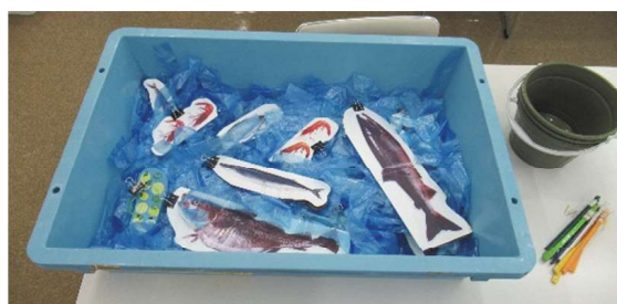
「魚釣りゲーム」の全体像