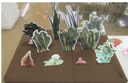
「野菜当てゲーム」の全体像

魚の写真を厚紙の表裏両面に貼り、厚紙が開かないようクリップで留めました。魚の内側には、魚の名前、長さ(cm)、旬の時期、その魚を使った料理や加工食品を書きました。釣り竿は割りばしで作り、釣り針には磁石を使用し、魚を留めたクリップと磁石がくっつくことで釣り上げられるようにしました。釣った魚を入れるバケツも準備しました。海洋ごみとしてペットボトルとビーチサンダルも入れておき、環境問題についても考えてもらうようにしました。