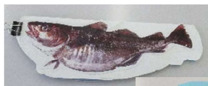
「タラ」(上)と 「タラの紹介」(右)