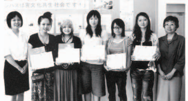
シンボルマーク入選者表彰式 (7月27日 国際交流プラザ) シンボルマークコンテストの受賞者の皆さん。50点もの応募の中から、投票により1等賞、2等賞のほか、センター長賞、副センター長賞などが決まりました。