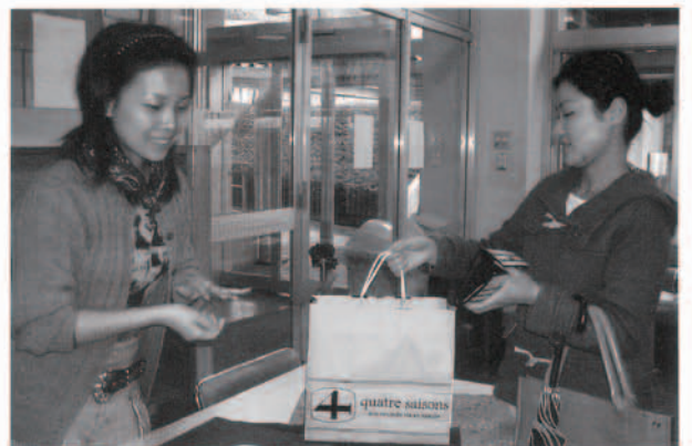
4月に行われたバザーの様子 (国際交流プラザ) 5日間のバザーは好評のうちに終了しました。教職員の皆さんから多大なご協力をいただき、無事バザーを開催することができました。