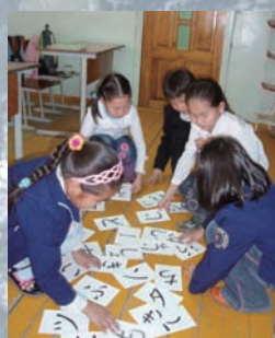
▲ひらがな 2年生 2年生から文字を学びます。かるた遊びの要領で文字を探して言葉を作ります。 (写真・キャプション 古宇田亜由美さん)