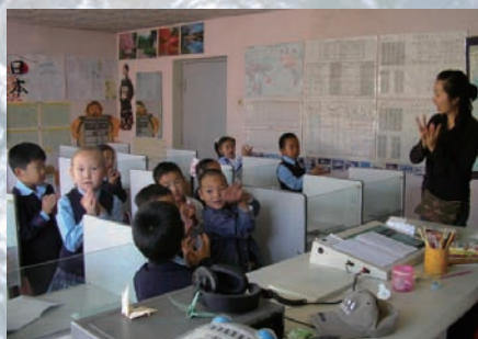
▲歌 1年生 1年生では文字を使わず、「もの名前」を中心に学びます。歌ったり、踊ったり、絵を描いたり、元気いっぱいの子ども達。 (写真・キャプション 古宇田亜由美さん)