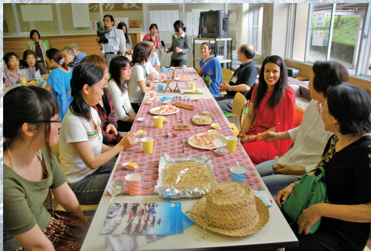
▲ネパールカフェ「サティ」の様子

また、6月24日に、町田キャンパスの国際交流プラザでネパール・カフェ「サティ(ネパール語で“友達”の意)が開かれました。ネパールの装飾品、アクセサリー、テーブルクロス、パンフレット等が飾られた中、ネパールのお茶とお菓子を楽しみながら、民族衣装のサリーに身を包んだ留学生からネパールのお話を聞きました。参加した学生、教職員、地域サポーターの40名あまりは、帰る時にはすっかりネパールの「サティ」になりました。