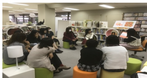
写真2 絵本コーナーでの読み聞かせ演習

文献・インターネット等を用いて教材研究した後、教師役・生徒役のロールプレイを用いた模擬授業を行っています。模擬授業では、可動式椅子・テーブルを活かしたグループワークを取り入れたり、電子黒板を駆使し、パワーポイントに手書きの情報や動画を重ねたりするなどの工夫が見られます(写真1)。また、絵本コーナーでは読み聞かせ演習が行われています(写真2)。