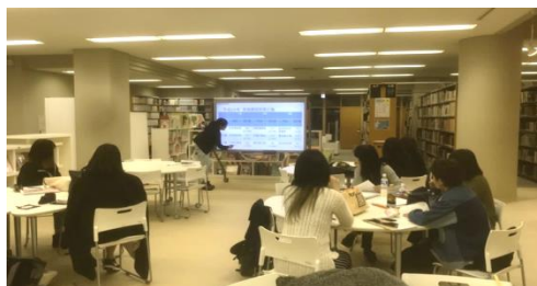
写真1 電子黒板を活用した模擬授業

文献・インターネット等を用いて教材研究した後、教師役・生徒役のロールプレイを用いた模擬授業を行っています。模擬授業では、可動式椅子・テーブルを活かしたグループワークを取り入れたり、電子黒板を駆使し、パワーポイントに手書きの情報や動画を重ねたりするなどの工夫が見られます(写真1)。また、絵本コーナーでは読み聞かせ演習が行われています(写真2)。