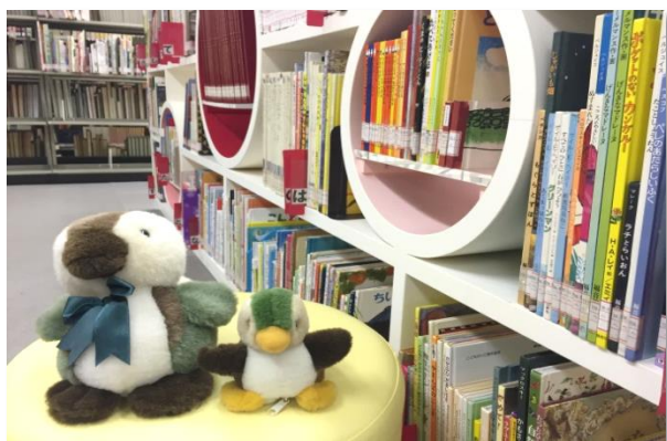
町田図書館1階 絵本コーナー書架