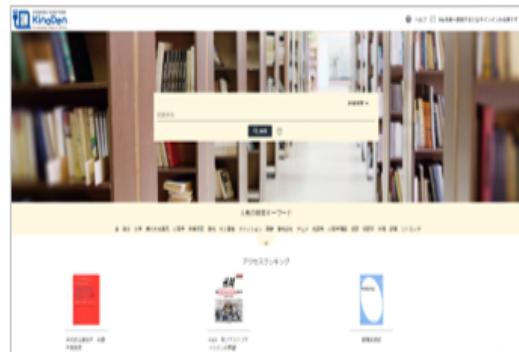
図書館ホームページ トップ画面

Gmailのアドレス(~@kasei-gakuin.ac.jp)を使用してサインイン 図書館よりお送りしたメールに記載されている シリアルコード を 『シリアルコード認証を入力してください』と表示されたら、 入力してください