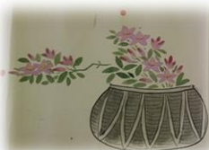
花道秘傳書之巻 (天明6年、1786)・本学教員寄贈著書紹介・新着図書紹介