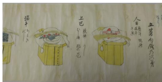
五節句飾巻 (寛政10年、1798)