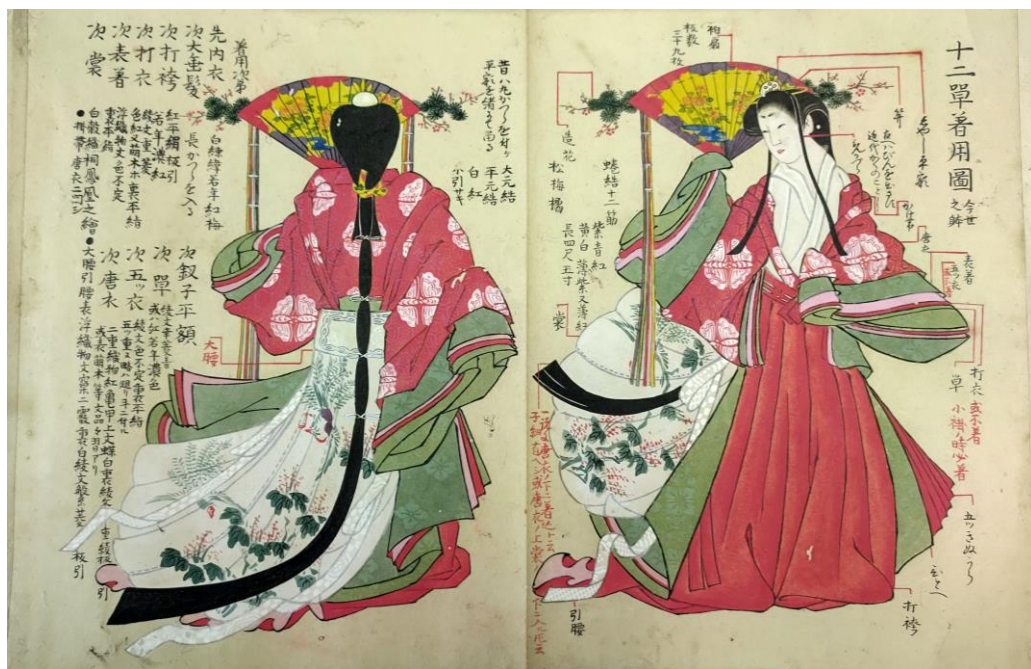
十二単着用図(等) 大江文庫所蔵