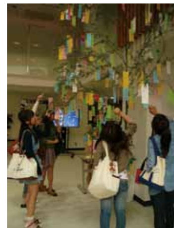
七夕に願いを込める学生たち

学生達には、まだ彥星様が現れていないらしく、現実的かつ切実なお願いがいっぱいでした。