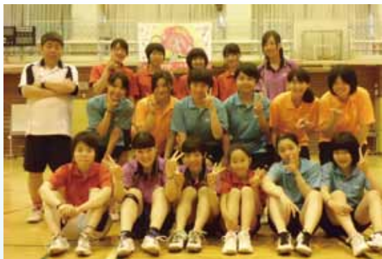
全国大会に出場した高校バドミントン部