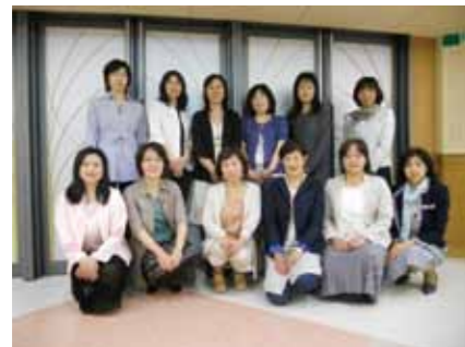
学年幹事の皆さん

総会では、少子化により卒業生数が減少しているため、卒業時に納める終身会費が激減していることから、終身会費の値上げを議題にあげ、承認をいただくことができました。皆様のご理解に深く感謝いたします。