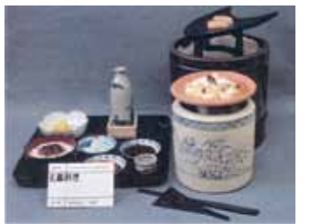
江戸時代の会席料理