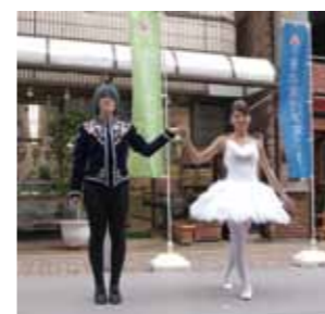
第2部 王子ジークフリードとオデット姫の衣装

最後には、時が経つにつれて忘れがちな震災に対して、継続的な復興支援を皆様に呼びかけて募金活動を行いました。