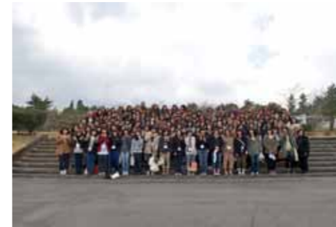
雲の中の富士山を背に集合写真