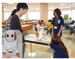
マスコットとして活躍するPaPeRo