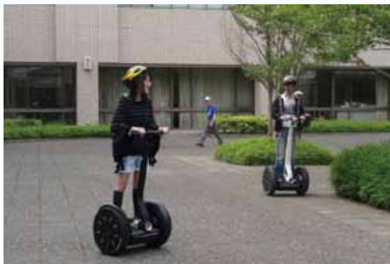
セグウェイ講習会の様子