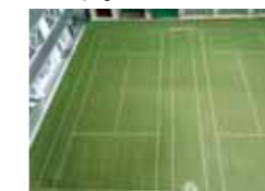
テニスコートの整備 (千代田三番町キャンパス)