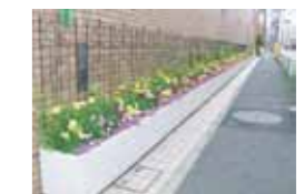
植栽プランター設置 (千代田三番町キャンパス)