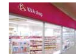
KVAショップ(コンビニ)設置 (町田キャンパス)