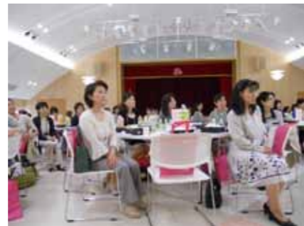
吹奏楽部の演奏に聴き入る会員

をいただき、吹奏楽部が演奏を披露してくれました。松田聖子さんの曲をメドレーで聴かせてくれました。最後はアンコール! アンコール!と拍手が止みませんでした。が、校内見学が控えているため希望は叶わず、その代わりに校歌を演奏してください。皆で斉唱しお開きとなりました。