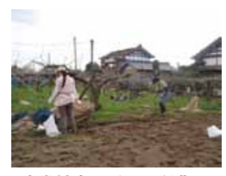
竜巻被害を受けた梨農園でのボランティア活動

その後も、OCPの一環として、5月下旬には、北条復興チャリティーライブの運営サポート、七夕には、原発事故の影響で福島から茨城県内に避難している方々と北条復興七夕飾りを行うなど、筑波学院大学の持ち味を活かした、継続した支援を行っています。