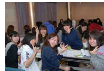
先輩のアドバイスで時間割完成

を直接に聞くことや他大学の研究成果を知ることを通じて本学での学びに自信を深めました。また、本学の実践的な教育研究活動や地域貢献の取り組みを来場したお客様にアピールすることができました。加えて、多くの卒業生も来場され、後輩の学生達の活躍を喜んでくださいました。