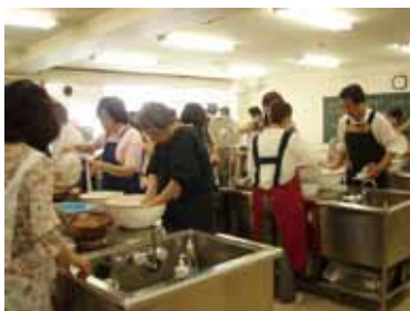
公開講座「味噌づくり」

地域とのつながりと言ったことでは、毎年、公開講座「味噌づくり」を開催しています。これも短期大学の頃から千代田三番町キャンパスを中心とした地域の方々を対象とした講座で、