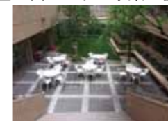
中庭の整備 (中学・高等学校)