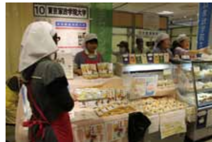
本学ブースで販売を行う学生たち

今後このようなイベント等の機会を積極的に活用し、教育研究の成果の発表や地域連携の充実を図っていきたいと考えています。