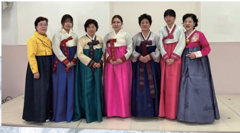
▲モデルをつとめた両学の学生たち

釜山女子大学校の学生は、家庭や仕事が落ち着いてから大学に入った方々ばかりで、本学の国際交流会の学生にハンボクを着付け、お辞儀の作法などを教えて下さいました。一方、本学の学生達は、通訳アプリを駆使してコミュニケーションを取り、国も年代も超えた大変思い出深い交流となりました。