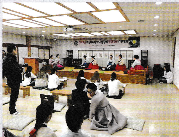
▲ 釜山女子大学校の韓国茶道コンテストの様子

※時間及び実施場所・方法等の詳細は決定後ご案内します。 本学学生、教職員、地域サポーターの皆さんにご参加頂けます。